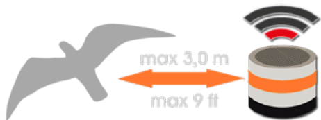
Máximo alcanza al exterior

Al igual que en la fase de aclimatación, el sonido debe detenerse al menos 30 minutos antes de la cooperación activa con su animal.