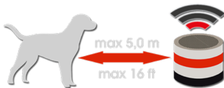
Máximo alcance al interior